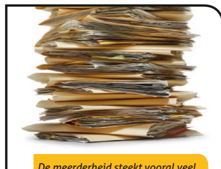
De meerderheid steekt vooral veel lapmiddelen in het meerjarenplan.

De N-VA vindt dus dat de meerjarenplanning een duidelijke visie mist. Met een goed georkestreerde media-show gaan we het tij niet kunnen keren. Met lapmiddeltjes allerhande probeert men mensen zand in de ogen te strooien. Maar gelukkig beginnen de ogen van de Neerpeltenaar open te gaan.